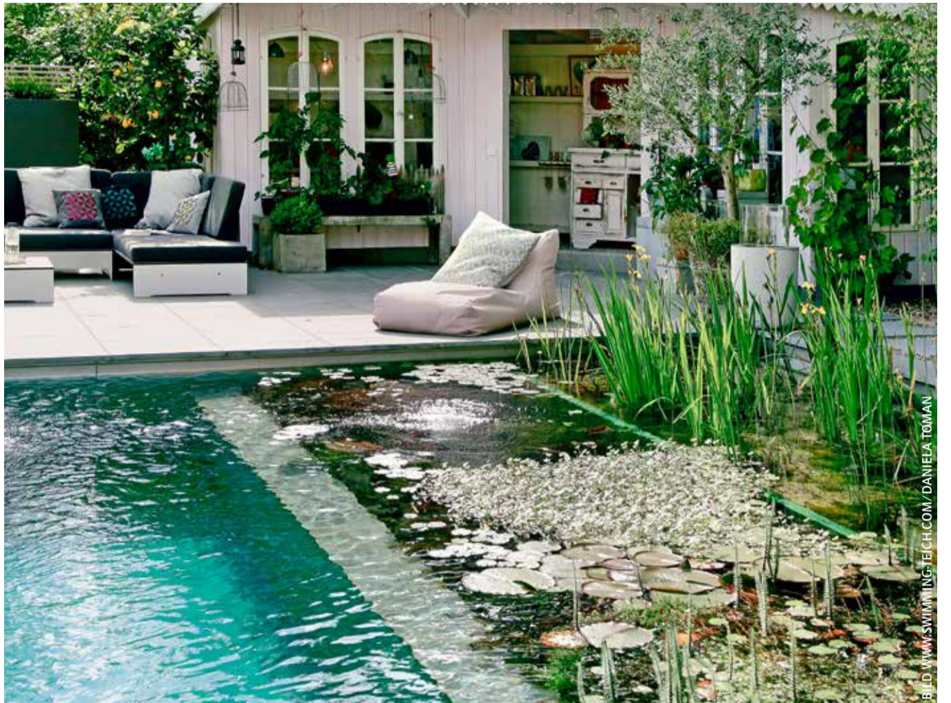
Dieser Schwimnteich im klaren rechteckigen Grundriss zeigt eine konsequente innere Gliederung, die in stilisierter Form die Vegetationszonen eines natürlichen Sees abbildet. Der Bereich rechts wird zur Wasserregeneration benutzt. www.swimming-teich.com

Mit dem Einbau des Pools ist es aber noch nicht getan. So werden in unseren Breitengraden Pools meist